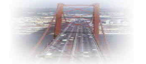
O Ozono é um dos principais componentes da poluição atmosférica

Mesmo em níveis baixos pode causar uma série de problemas respiratórios graves. Contudo, podemos ter alguns cuidados para ajudar a proteger a nossa saúde contra os seus efeitos.