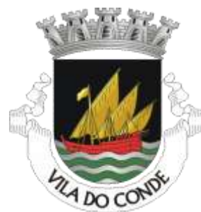
Câmara Municipal de Vila do Conde